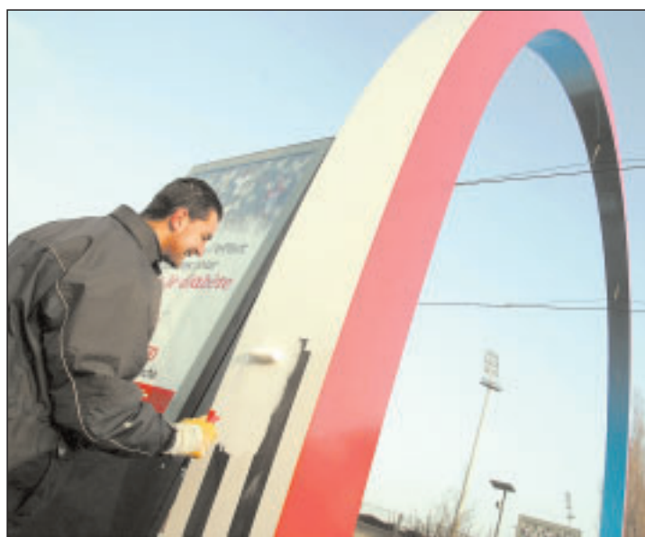
Sur certaines arches, des parties ont paru mal finies à l'architecte Daniel Buren. Les couleurs doivent donc être reprises.

On les croyait posées, les 26 arches de Buren. Fichées au sol, n'attendant plus que le passage des premiers tramways sous leurs courbes. Posées, elles le sont. Alors pourquoi les repeint-on déjà ? On ne les repeint pas toutes. Mais pourquoi certaines ? Voyons le cas calmement.