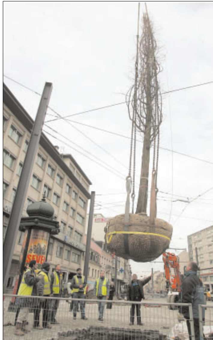
Des arbres quasi-adultes. Ce sont des séquoias de Chine, dont les feuilles rougissent un peu avant de verdir.